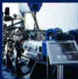
Instrumentation and Test Systems