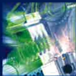
Advanced Simulation Technology